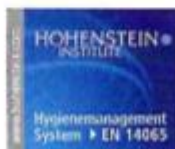
Markus Beeh Zertifizierungsstelle Managementsysteme