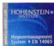
Markus Beeh Zertifizierungsstelle Managementsysteme